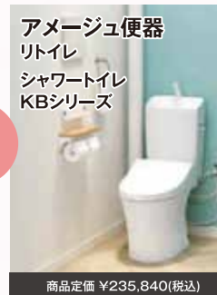
アメージュ便器 リトイレ シャワートイレ KBシリーズ