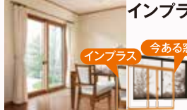
インプラス 今ある窓 インプラス

腰窓 W900 × H700 枠/完成品障子(単板ガラス5mm) 商品定価 ¥42,900(税込)