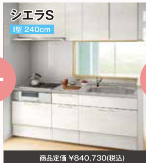
シエラス I型 240cm