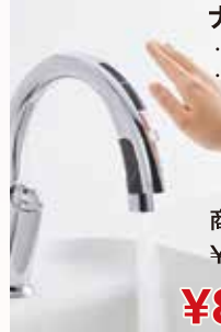
ナビッシュ ・B5タイプ ・乾電池式