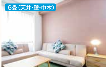
6畳(天井・壁・巾木)