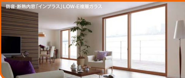
防音・断熱内窓「インプラス」LOW-E複層ガラス