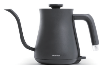
BALMUDA The Pot カラー：ブラック