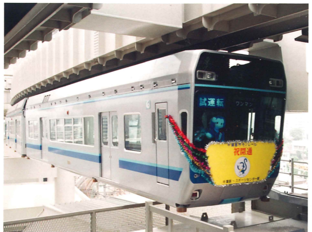
写真7. 千葉モノレール千葉駅～スポーツセンター駅開通