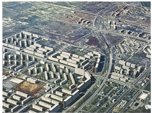
写真4. 整備が進む海浜ニュータウン(稲毛海岸駅周辺)