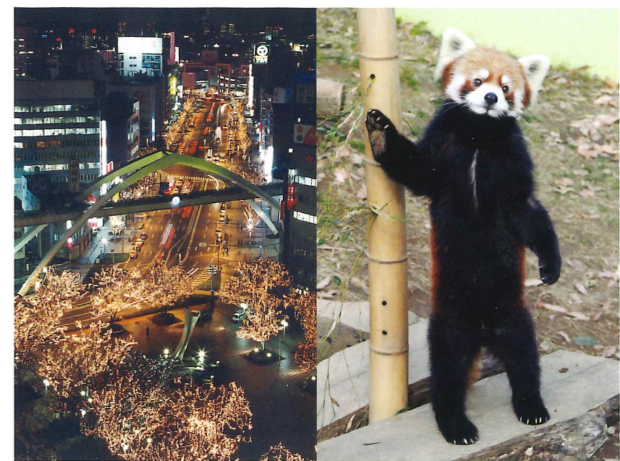
写真8. 夜のまちを彩るルミラージュちばと風太くんの立ち姿