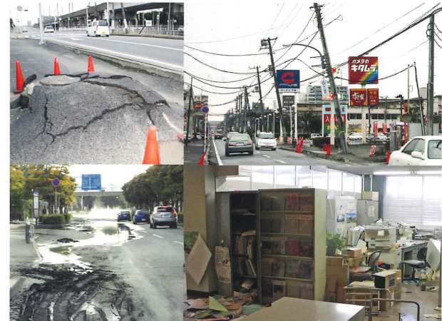
写真9. 市内でも大きな被害が出た東日本大震災(3.11)