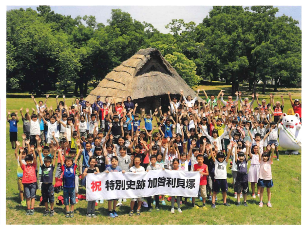
写真10. 加曾利貝塚が県内初、貝塚としても初の特別史跡に