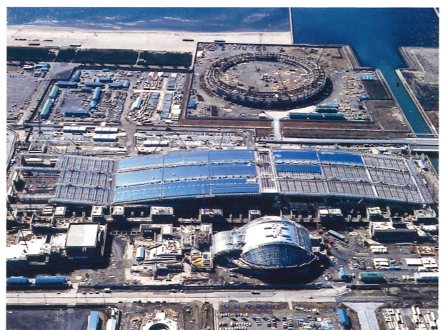
写真6. 建設中の幕張メッセとマリンスタジアム