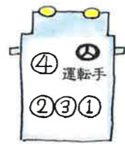
タクシーの下座・上座の順番