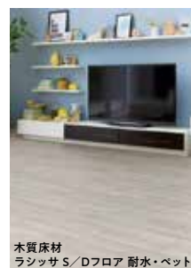
木質床材 ラシッサ S/Dフロア 耐水・ペット

まずはドライシートのフローリングワイパーで抜け毛を集め、ウェットシートで細かい被毛を除去してから掃除機をかけましょう。掃除機で抜け毛を吸ってしまうと、毛に付着している皮脂で排出される空気が臭くなってしまいます。