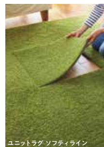
ユニットラグ ソフトイライン

基本的にはフローリングと同様、まずは抜け毛を取り除いてから掃除機をかけます。抜け毛の除去にはペット専用のお掃除スポンジがあると便利! 他にもエチケットブラシやゴムの滑り止めが付いている軍手も役立ちます。