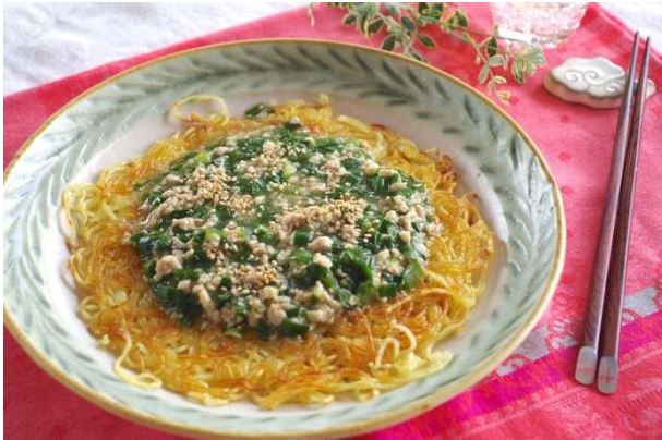
「カリカリ焼きそばのニラそぼろあん」 市販の焼きそばがごちそうに大変身！