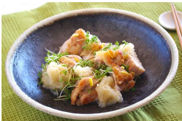
「豚肉のさっぱりみぞれ和え」 旨味を含んだ豚肉をさっぱりと！