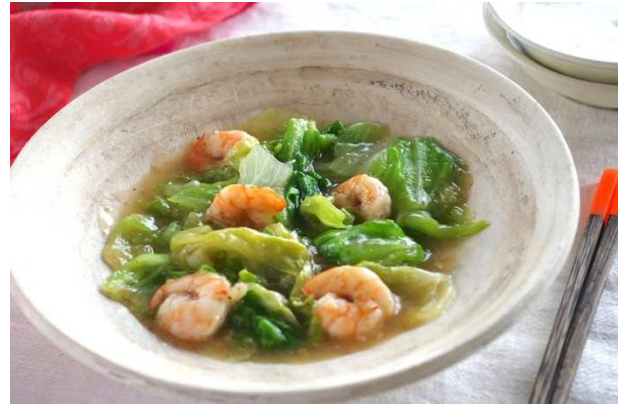
「えびとレタスのサッと炒め」 ぷりぷりえびとシャキシャキレタス 食感も楽しんで！