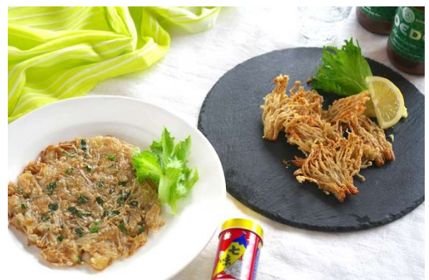
「えのき餅」&「えのきチーズせんべい」 えのきで絶品おつまみ2品

＊ゆっくりペースで、ていねいに進めるので、ビギナーさんでも安心してご参加ください！ ＊アレンジのアイデアや残った材料の使い方など、役立つヒントがいっぱい！！ ＊レシピを十分に活用していただければ、レパートリーもグーンと広がりますよ。