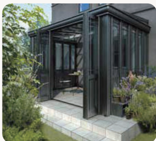
エクステリア 暖蘭物語・ジーマ・ココマ ガーデンルーム GF