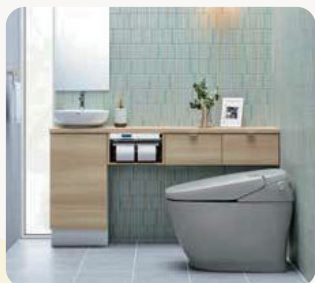
トイレ サティス・リフォレ フロートトイレ