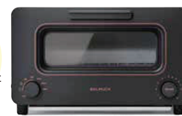
パルミューダ BALMUDA The Toaster

パルミューダだけのスチームテクノロジーとパンの特徴に合わせて調整された緻密な温度制御によって、誰でも簡単に感動の味を実現。