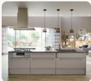
キッチン リシェル