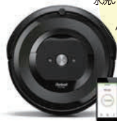
アイロボット iRobot ロボット掃除機 ルンバe5 ブラック

AerForce クリーニングシステム搭載。水洗い可能なダスト容器など、お手入れも手軽なハイエンドモデル。