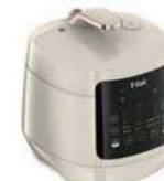
T-fal ティファール コンパクト電気圧力鍋 ラクラク・クッカープラス

発酵＆ベイクでパンまで焼ける! 無水調理モードなど、1台16役の多彩なお料理もボタンを押したら後はおまかせ時短調理が可能。