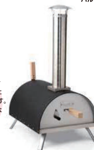
ファイヤーサイドポータブルピザオーブン KABUTO

KABUTO は薪窯の性能をギュッとコンパクトにした可愛らしいデザインです。どこでも持ち運べて様々な場所でピザパーティーが楽しめます。