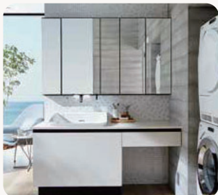
洗面化粧台 ルミス