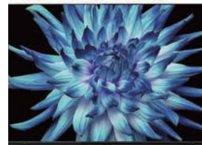
東芝 液晶テレビ REGZA(レグザ) 43C350X