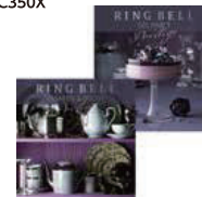
リンベル カタログギフト

時代を越えて愛される老舗や話題の名店の味、職人の創り上げる珠玉の一品。また、こだわりの食材から生まれる特別な料理など、遊び抜いた、心に響く至福の味覚をセレクトション。