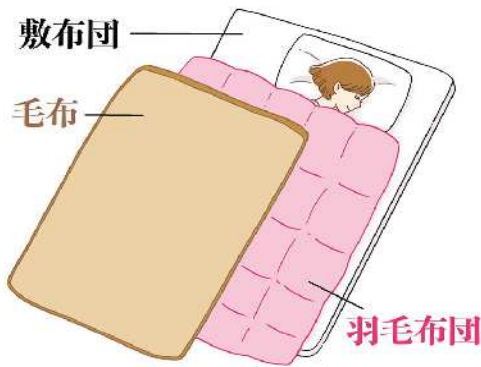
羽毛布団と毛布を使うときは、毛布を上にした方が羽毛布団の保温機能を十分に活かせます。

起床後は口腔ケアをしてから、コップ1杯の水を飲みましょう。寝ている間に失われた体内の水分を補い、血液の流れをスムーズにするメリットが。