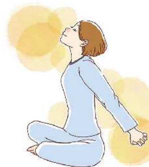
イラスト②ストレッチは一つの動きにつき、10〜15秒程度が目安。無理のない範囲で行いましょう。

て手を後ろに組み、肩甲骨を引き寄せようにして腕を斜め後ろに伸ばしましょう(イラスト②)。 朝には、15〜30分ほど、日光を浴びることをおすすめします。朝日を浴びることで、メラトニンという睡眠ホルモンの分泌が抑制され、体内時計がリセットされます。そして、脳と体を目覚めさせてくれるセロトニンという物質が分泌されます。そして、14〜16時間後には再びメラトニンが分泌されると言われているので、起きる時間と寝る時間のリズムが整います。