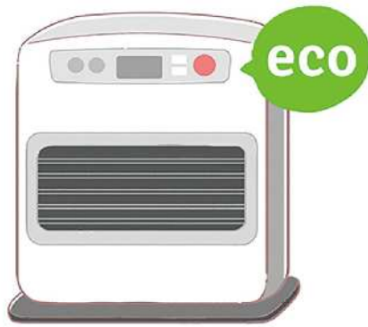
暖房器具は、暖めすぎを防ぐエコ運転などを利用するのも良いですね!

●ガスを使った暖房器具を使うとき ガスの床暖房は、スイッチを切った後も、しばらくは暖かさが残るので、寝る前やお出かけ前は少し早めに切るとガスの節約になります。 ガスファンヒーターは、フィルターを掃除することで、運転効率の低下を防ぎ、ガスの節約になります。 暖房器具の設定温度を低くし、厚手のカーテンや着るものに工夫すれば節約になりますね。