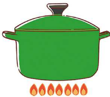
お湯を沸かすときはフタをすることで、熱が逃げのを防ぎ、早く沸くので省エネにつながります。

●キッチンでガスを使うとき 鍋やかんを使うとき、火力が底面からはみ出さないようにしましょう。底面より火がはみ出しても鍋やかんには伝わらないので、ムダになります。 料理のときに、煮込み料理は長時間火にかけなければいけません。短時間で仕上がる圧力鍋や、保温性が高い鍋を使うことも手です。保温性が