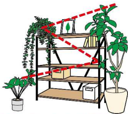
最上段は、グリーンネックレスなど、垂れ下がるように育つ植物を置くと、印象的なアクセントに！

配置に迷つたら、置きたい場所に植物を置き、部屋全体の写真を撮つてみましょう。家具などとのバランスが客観的にわかるので、配置の調整がしやすくなります。ほかに、自分がよくいる場所から写真を撮つたり、植物を配置したい本棚を引きで撮つてみるのもおすすめです。自分にとつての絶妙な位置を見つけてみてくださいね。