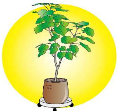
大きい観葉植物を移動させるのに、キャスター付きの鉢受けを使うと便利です。

土で育てている植物に、優しい光を当てることで、元気に育つ手助けになります。また、部屋に入ったときに真つ先に目が行く場所でもあるので、