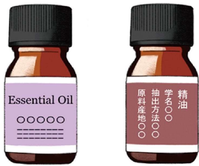
茶色などの遮光瓶に入り、表示に「精油」や「エッセンシャルオイル」とあるので、確認してみましょう

香りと言えばオイル。さまざまな香りがありますね。ちなみに、一般的によく「アロマオイル」と言われていますが、「エッセンシャルオイル（精油）」と違いがあります。エッセンシャルオイル（精油）は、100%天然成分の香りで、香りそのものを楽しむのはもちろん、マッサージなどにも使えます。アロマオイルは、精油100%でないものや、人工香料のものがあります。直接肌につけることは避けたいですが、手軽に香りを楽しむメリットがあります。 花粉症が気になるこの時期におすすめなのは、ユーカリやペパーミント。どちらも清々しい香りです。ユーカリは、抗菌作用があるといわれ、ペパーミントは、頭をすっきりさせる効果も