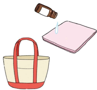
ハンカチに1滴オイルを落とし、嗅ぐのも効果的。外出先にも携帯できますね♪

新たな環境で生活を始める人が多い時期でもありますね。不安な気持ちをやわらげる香りで癒されましょう。ラベンダーはリラククスを誘う香り。ベルガモットやグレープフルーツなどの柑橘系の香りはさわやかで、リラククスはもちろん、イライラすると