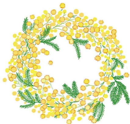
ミモザはリースにしても素敵！インターネットでも手に入るのチェックしてみは？

ハーブティーや生花で和み、気分を上げよう♪ ハーブティーで味わいとともに香りを楽しむのも良いですね。スッキリとした味わいのカモミールや、最近、シロップもよく見かけるエルダーフラワーは、鎮静効果があるとされています。 ハーブティーの淹れ方は、ティースプーン1杯をポットに入れ、95℃程度のお湯を静かに注ぎ、フタをして3〜5分蒸らしてからカップに注ぎましょう。ハーブティーはきれいな色も魅力。ぜひ、耐熱ガラスのカップで楽しんでみてください。 生花もおすすめ！自然ならではの繊細で色鮮やかな見た目と香りに気分が上がります。ミモザは、黄色い小さな花がかわいく、葉っぱの表情とも相まって、とっても華やか。ざっくり