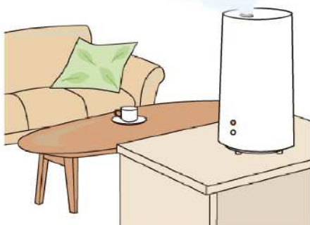
室内環境も大切！湿度は50～60%がおすすめ。適度な換気もお忘れなく！

士をすり合わせて全体になじませる ③残りのクリームを手の甲と手のひらですり合わせ、さらに全体になじませる ④手のひらで反対の手指1本1本を包むようにして指先まで塗りこみ、指の股や爪まわりも意識して塗る ほかに、喉を適度に潤してウイルスなどをスムーズに体外に排出できるように、こまめに水分補給をすることもおすすめします。