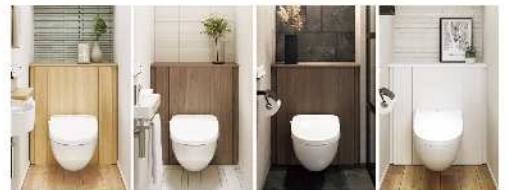
▲ライトオーク ▲ウォールナット ▲ショコラオーク ▲ホワイト 写真・記事：株式会社 LIXIL

間違いさがし答え：①猫の顔 ②こたつ布団の柄 ③テーブルの上のトランプの数 ④カレンダー ⑤カゴの中の毛糸の数