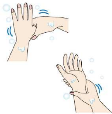
手洗いは、親指や手首もお忘れなく！優しくねじるように洗うと良いですよ！

爪や指先などを洗います。各5回を目安にすると、キレイに洗うことができますよ。水でよくすすいだら、清潔なタオルやペーパータオルで拭きましょう。