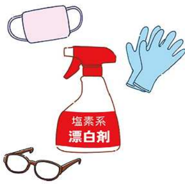
塩素系漂白剤はゴム手袋やメガネ、マスクなどをしてご使用を。

頑固なカビは、塩素系漂白剤を塗布し、キッチンペーパーやラップを貼り付け30分程おくと落ちやすくなります。パッキンやドアの下のくぼみなどは、たれずに密着するジェル状の漂白剤がおすすめです。カビ掃除の際にゴシゴシすると、素材に傷がつき、汚れやカビが入り込みやすくなるので避けましょう。また、塩素系漂白剤は、金属部分に付くと変色や腐食の恐れが