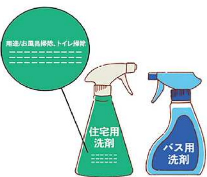
洗剤やクリームクレンザーは浴室専用のものや、住宅用なら説明書きで、浴室に使えることを確認してから使いましょう。

ます。泡沫ユニットや散水板も同様に。シャワーの穴は針を差して目詰まりを取りましょう。 浴槽の上縁にある排水栓の押しボタンも盲点では？ガムテープを貼り、一度ボタンを押し込んでから引き上げて外します。押しボタンのヌメリやゴミを取り除き、浴槽についた突起部はシャワーでお湯をかけながら上下に繰り返し動かして流し、最後に押しボタンを装着しましょう。