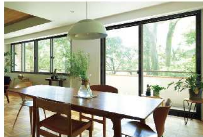
インプラス for Renovation 優れたデザイン性で空間に調和するリノベーションシリーズ。