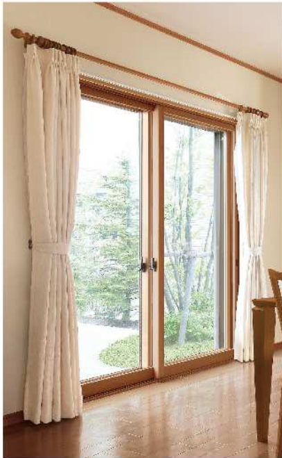
インプラス 対応窓種やカラーが豊富な、使い勝手に優れたシリーズ。

洗練されたデザインで機能性もバツグンの最新のリフォーム商品をいち早くご案内いたします。