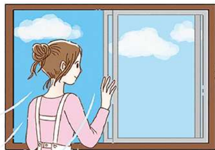
適度な換気も大切。掃除の際や部屋を移動するときなど、ちょっとした合間になると、おっくうになりませんよ。