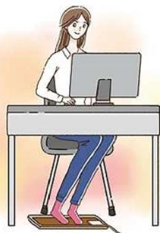
足元に置いて使うミニサイズのホットマットはリモートワークにおすすめ！効率良く足元を温めることができます。

ホットカーペットは、足元を温めるのに、とても助かります。しかし、長時間使用すると電気代がかかるので、半分だけ温める機能や省エネモードを使うと良いですよ。ひざ掛けや毛布の併用もおすすめ。また、専用のカバーかホットカーペット対応ラグをかけて使うようにしましょう。