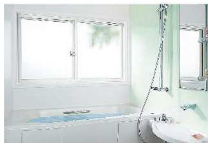
インプラス 浴室仕様 ユニットバスや在来浴室に後付けできる、浴室専用の商品。