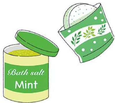
清涼感のある夏向けの入浴剤が豊富にあるのでチェックしてみてください

や、冷凍庫で冷やして使うひんやり枕、首に巻いてひんやりするタオルも節電しながら暑さ対策にもなります。保冷剤をガーゼやハンカチに巻いて首や頭を冷やすのも良いですよ。ちなみに、保冷剤を扇風機に設置して涼しさをアップできるアイテムもあるのが要チェックですね。入浴時にメント系の入浴剤を使うとスーッと気持ち持ちが良いです。ハッカ油を浴槽に3〜5滴入れるのもおすすです。