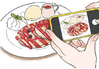
お皿を全部写さず、わざと切って撮るのもおしゃれですよ

テーブル上のモノを撮る際、被写体に照明の光や自分の影が映り込むときは、構えた位置からさらに上にスマホを移動し、いろんな角度で被写体をスマホの画面上で確認してみてください。照明の光も影も映らないポイントが見つかったら、そこから画面上