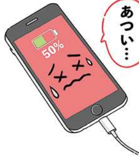
バッテリーのダメージに気を付けて、スマホを長持ちさせたいですね。