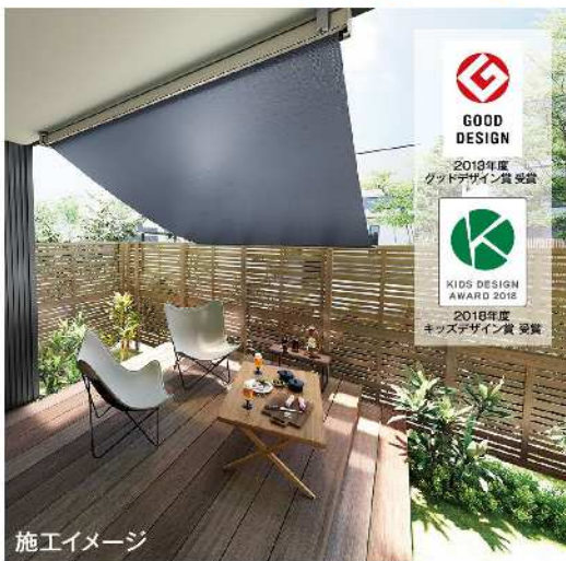
施工イメージ インディゴデニム