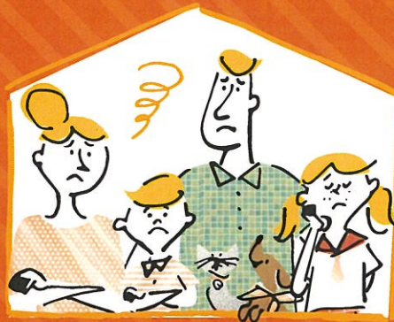
illustration © LIXIL + SHILUSHI. All Rights Reserved.