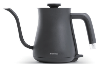
BALMUDA The Pot カラー：ブラック