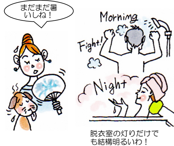
脱衣室の灯りだけでも結構明るいわ!

残暑で夏バテ~! 自律神経も暑さや冷房、ストレスなどで乱れがち…。1日2回の入浴で夏バテを解消してみませんか?