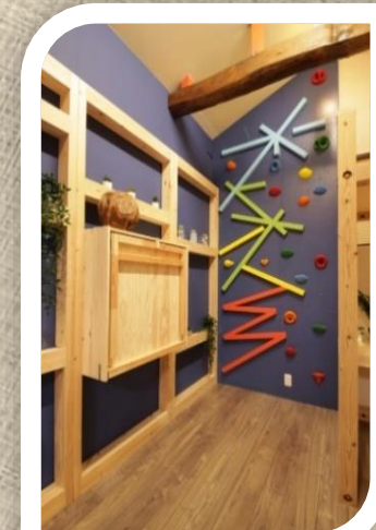
不思議な空間 【熱海 DESIGN】