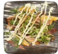
いかの一夜干しのあぶり

営業時間 16:00～ 定休日 火曜日・日曜日 豊中市蛸池東町2-5-3 クレール若竹ビル1階 TEL 090-8211-6669 阪急電鉄「蛸池」徒歩2分