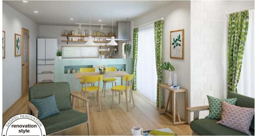
SAGASU RENOVATION style NATURAL STYLE

ラスティックな質感をいかしたちょっとした遊びがあるインテリア。カリフォルニアの生活スタイルをコンセプトに表現。