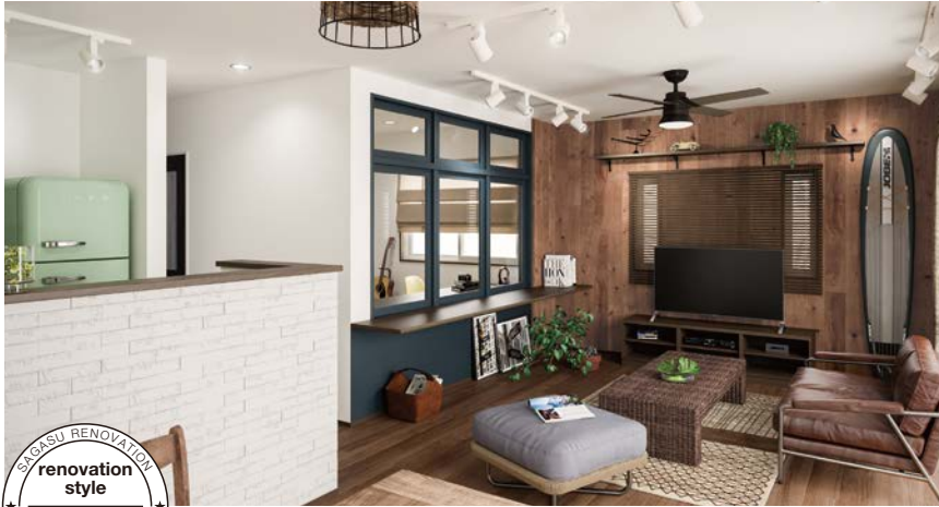
SAGASU RENOVATION style VINTAGE STYLE

LIXIL リフォームショップがお届けする「さがすリノベーション」は、憧れの住まいのカタチを変え、そして、ヒトの気持ちを変える家づくりをお手伝いします。