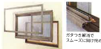
ガタつき解消で スムーズに開け閉め。

既存の窓から障子を外し、リプラスを既存の窓の枠にかぶせて取り付けるカバー工法。わが家の窓がパツと気軽に美しく快適な窓に生まれ変わります。