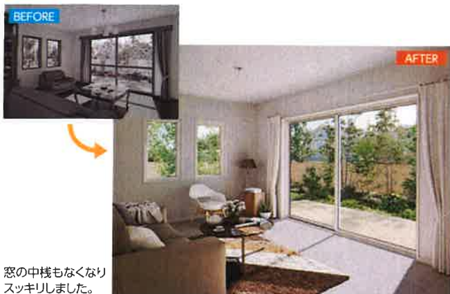
窓の中棧もなくなり スッキリしました。