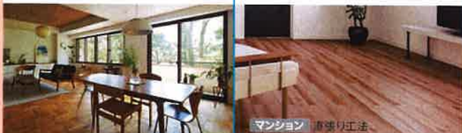
マンション 直張り工法