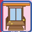
ウッドデッキ工事

キッチン・浴室・トイレの取替、断熱工事、増改築、壁紙の張替え、床材の張替え、畳の表替え、ウッドデッキ工事、バリアフリー化、屋根付き駐車場工事、外壁・屋根等の塗替え、給湯器の設置 など ※住宅の新築工事・建替工事、外構工事及びカーテン・家具などの備品、家電製品の購入費などは対象外となります。