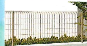
※画像はご参考写真です。