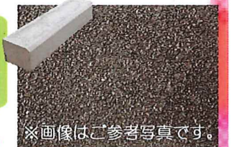
※画像はご参考写真です。