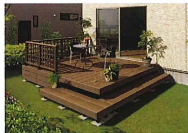
※画像はご参考写真です。