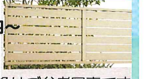
※画像はご参考写真です。