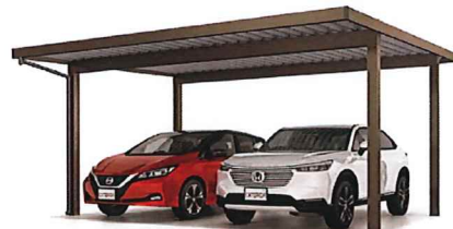
※画像はご参考写真です。