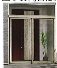
※画像はご参考写真です。