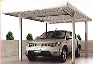
※画像はご参考写真です。