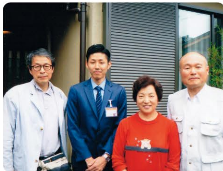
大工 店長 松山 お施主様