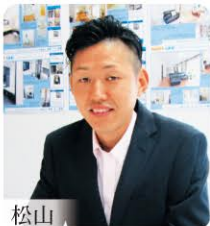
松山 二級建築士 住宅検査技術者(インスペクター)