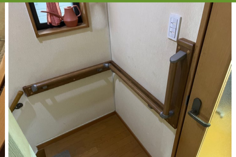
■階段踊り場の手すり

訪問させていただいた時、ご自宅に20年前の新築工事の上棟式の写真や完成時の写真を大切に額に入れて飾っていただいております。大変感謝がたたく喜しく思いました。