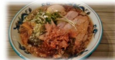
▲味玉節中華そば 麺やダイニング きかん棒 山形市浜崎8

今月は、山形市浜崎の「きかん棒」に行ってきました。 私は「味玉節中華そば」です。注文の際に太麺か細麺か聞か れたので太麺にしてみました。思ったより太かったですが、 もちもちした縮れ麺で、魚介スープにも合っておしかったです。 カイワレ大根や鰹節がのっけていて、見た目よりもあっさりし ている味で、スープもおいしくいただきました。 子供連れでも入りやすそうなお店でした。