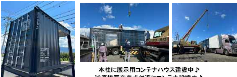
本社に展示用コンテナハウス建設中♪ 浅原橋西交差点付近にコンテナ設置中♪

コンテナハウス 2040(ニイマルヨナル)山梨.jp は山梨県を拠点にして、デザイン性が高く、安全かつ安心できるコンテナハウス をお客様にご提供いたします。 法律を熟知しデザインセンスにも優れた建築士が、お客様のご希望に沿って建物を設計します。 使用するコンテナは輸送用コンテナとは違い、建築用に開発されており、日本の法律を順守したコンテナ型建築モジュールです。 地震にも強く、耐久性があり、リサイクル可能なコンテナ建築で、お客様の希望をかなえます。 コンテナハウスの建築をお考えでしたら、是非一度ご相談ください。