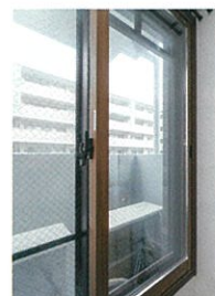
個室には寒さと結露軽減のために断熱内窓を設置しました

LDKと統一感を考え、モノトーンで仕上げた浴室。床は足触りも優しく、掃除もしやすいそうです。