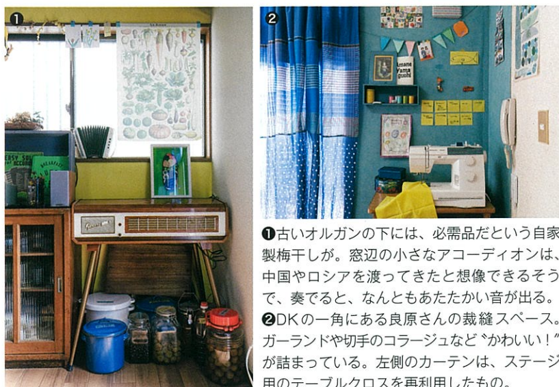
1 古いオルガンの下には、必需品だという自家製梅干しが。窓辺の小さなアコーディオンは、中国やロシアを渡ってきたと想像できるそうで、奏でると、なんともあたたかい音が出る。 2 DKの一角にある良原さんの裁縫スペース。ガーランドや切手のコラーージュなど「かわいい!」が詰まっている。左側のカーテンは、ステージ用のテーブルクロスを再利用したもの。

キッチンの扉は、落ち着いたブルーに、友人のアドバイスで既存のアイボリーの扉を活かしてコントラストを効かせた。普段使いのコーヒーグッズやどこか愛嬌のある時計、アコーディオンの楽譜本、旅先で出合ったキッチン道具など「大好き!」を凝縮した空間。