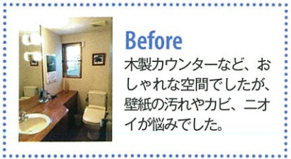
Before 木製カウンターなど、おしゃれな空間でしたが、壁紙の汚れやカビ、ニオイが悩みでした。

タンクレスで汚れがつきにくく、掃除がラクなトイレ本体に変更し、ペールグリーンを基調に、花柄のアクセントクロスやエコカラットで空間にメリハリをつけました。「リフォームして1年以上経ちますが、カビも生えず、清潔感のあるトイレです」と奥様。