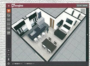
プランニング当初は、キッチンにテーブルカウンターを設けていたが、ダイニングが近いので、収納に変更して大正解！暮らしのイメージもしやすいです。