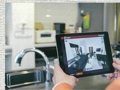
タブレットを操作し、実際にその空間のなかにいるような体験もできます。

打ち合わせでプランをご説明しても、平面の図面ではなかなかイメージがわからない場合があります。そこで「リフォームアクセル」というツールでご提案。間取りを立体的に見せることで、空間をより具体的にイメージできるので、S様にも「わかりやすい！」と喜んでいただけました