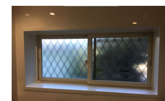
浴室窓 インプラス取付