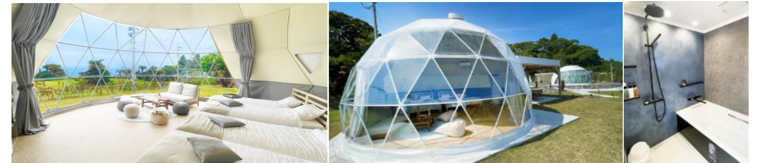
各部屋から見える景色もシチュエーションもそれぞれ違います。 外観です。カーテンでプライベートは守られます。 風呂・トイレ・洗面台完備。

以前にも『えびの高原』のグランピングをご紹介しましたが、今回は『串間市』の施設をご紹介します。宮崎県が誇る馬の楽園都井岬にグランピング宿泊施設がオープンしました。ドーム型のお部屋は全部で9つあり、それぞれの部屋の特徴がありますが全てが素敵なお部屋でした。食事の材料は持ち込みOKです!! 各部屋にガスグリルがあるので、好きなものを好きなだけ召し上がる事が出来ます。持ち込みをされない方には、『夕食・朝食・ピザセット』の注文が出来ます。(3日前までに予約必須)。水平線と山並みを望む絶好のロケーション、目に映るものすべてが写真映えますよ。運がよければ野生の馬が敷地近くまで牧草を食べに来てくれることもあるそうですよ!(馬は触っちゃダメですけど...)。オプションで朝ヨガも体験もできます。ヨガの予約も3日前です。朝日を浴びながら大きく深呼吸して気持ちもリフレッシュ出来たら最高ですね。是非注目のスポットで楽しんでみて下さい(*^^*)