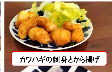
カワハギの刺身とから揚げ