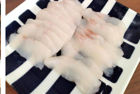
メジナの炙り刺身