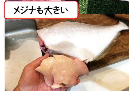
ジャンボカワハギには大きな肝が!