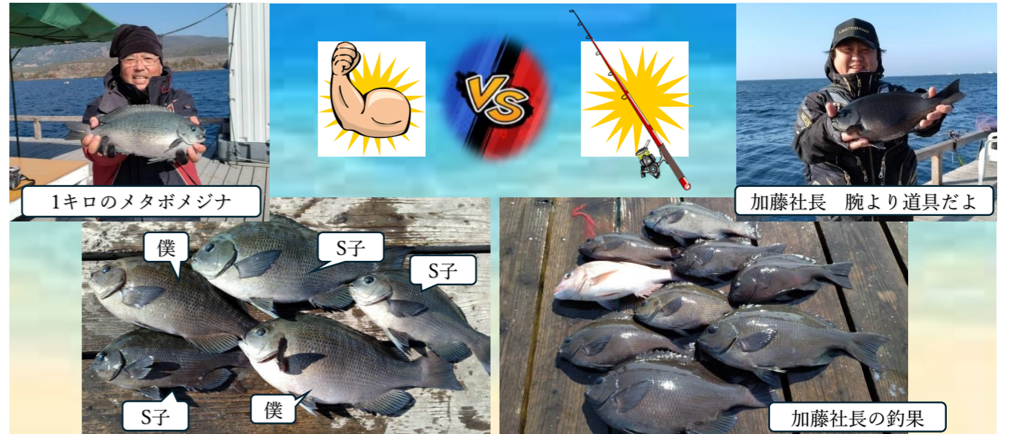
1キロのメタボメジナ