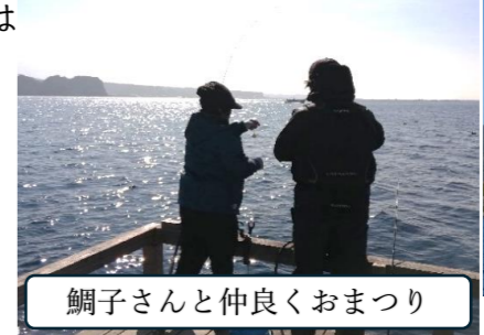
鯛子さんと仲良くおまつり