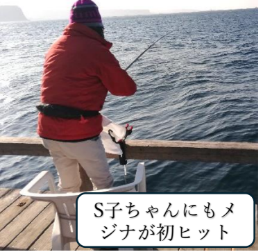
S子ちゃんにもメジナが初ヒット