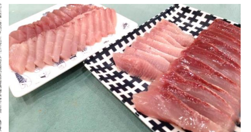
ブリしゃぶと刺身・照焼きで頂いた