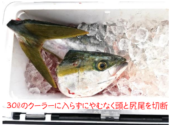
30Lのクーラーに入らずにやむなく頭と尻尾を切断