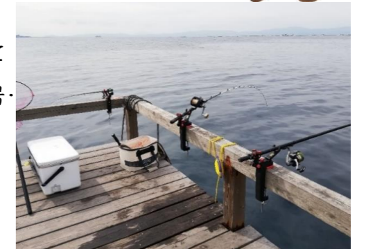
手前からアジ泳がせ、アジサビキ、フカセ釣り