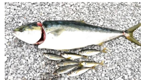
ブリ合体!!アジゴはブリと人間の共通餌