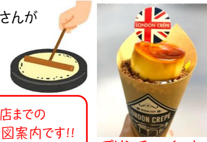
プリンチョコクッキー