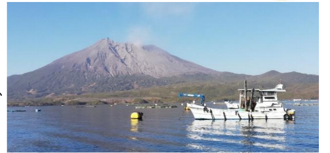
雄大な桜島を眺めながら

15分位かかったらろうか、最後は鯛子さんのタモに収まりフィニッシュ!! 共同作業の成功に2人抱き合って喜んだ。