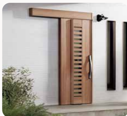
玄関ドア リシエント・ジエスタ エルムーブ(リニアスライドシステム)