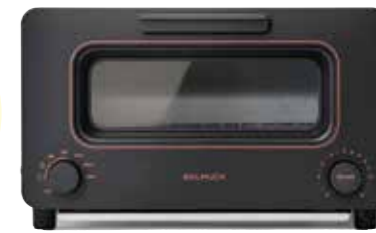
バルムューダ BALMUDA The Toaster

バルムューダだけのスチームテクノロジーとパンの特徴に合わせて調整された緻密な温度制御によって、誰でも簡単に感動の味を実現。