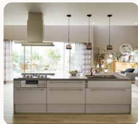
キッチン リシェル