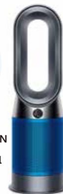
ダイソン Dyson HP04IBN 空気清浄ファンヒーター Dyson Pure Hot + Cool アイアン / ブルー [首振り機能]

LCDディスプレイに空気の状態を表示。空気清浄機、ヒーター、扇風機の1台3役。350°首振り機能で、部屋全体に空気を循環。