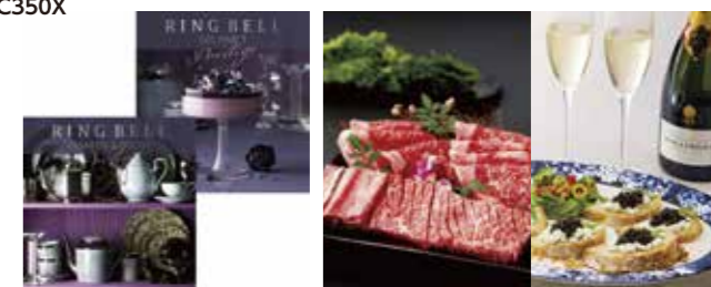
リンベル カタログギフト

※在庫状況により納期がかかるものもございます。 ※商品改定により写真と異なる型番になる場合もございます。あらかじめご了承ください。