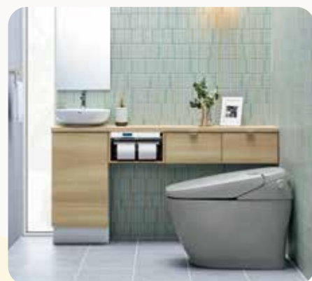
トイレ サティス・リフォレ フロートトイレ