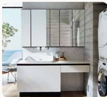
洗面化粧台 ルミス