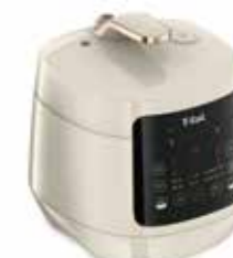
T-fal ティファール コンパクト電気圧力鍋 ラクラ・クッカープラス

発酵&ベイクでパンまで焼ける! 無水調理モードなど、1台16役の多彩なお料理もボタンを押したら後はおまかせ時短調理が可能。