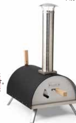
ファイヤーサイド ポータブルピザオーブン KABUTO

KABUTO は薪窯の性能をギュッとコンパクトにした可愛らしいピザオーブンです。どこでも持ち運べて様々な場所でピザパーティーが楽しめます。