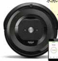
アイロボット iRobot ロボット掃除機 ルンバ e5 ブラック

AeroForce クリーニングシステム搭載。水洗い可能なダスト容器など、お手入れも手軽なハイエンドモデル。