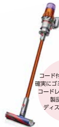
ダイソン SV18FFCOM Dyson Digital Slim Fluffy スティッククリーナー [サイクロン式 / コードレス]

コード付き掃除機よりも確実にゴミを吸い取ります。コードレス掃除機史上初、製品本体に液晶ディスプレイを搭載。