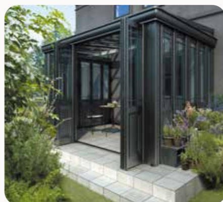
エクステリア 暖蘭物語・ジーマ・ココマ ガーデンルーム GF