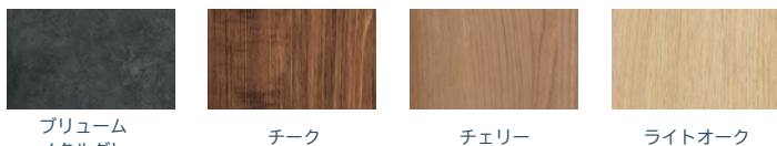
プリューム メタルグレー