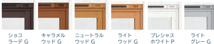
ショコ ラーデ G

すべての本体カラーで選択できる！※インプラス for Renovation を除く