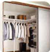
ウォークインクローゼット