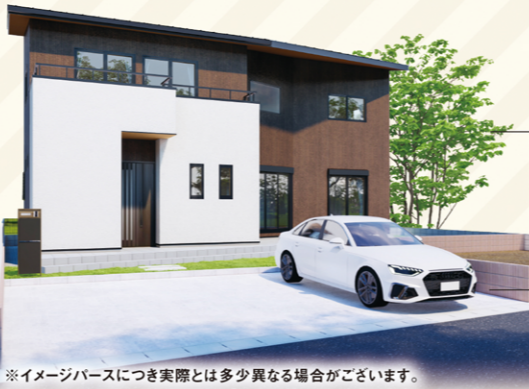
※イメージベースにつき実際とは多少異なる場合がございます。