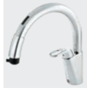
B5 RSF-671A RSF-671NA