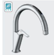
A7 (エコセンサー付) SF-NAA471SY ¥124,000 SF-NAA471SYN ¥127,000