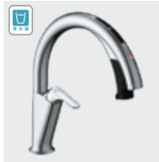
H6 (浄水器ビルトイン形) JF-NAH461SY(JW) JF-NAH461SYN(JW) ¥168,000