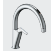
A5 SF-NAA451SY ¥103,000 SF-NAA451SYN ¥106,000