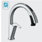
H7 (エコセンサー付) SF-NAH471SY SF-NAH471SYN ¥145,000