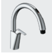
B5 SF-NAB451SYX ¥87,000 SF-NAB451SYXN ¥90,000