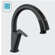
H6 (浄水器ビルトイン形) / サテンブラック JF-NAH461SY/SAB(JW) JF-NAH461SYN/SAB(JW) ¥223,000