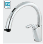
乾電池式B5 RSF-672A RSF-672NA