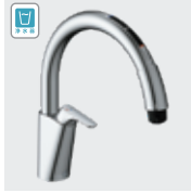
B6 (浄水器ビルトイン形) JF-NAB466SYX(JW) ¥137,000