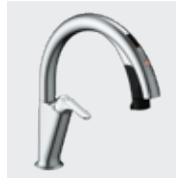
H5 SF-NAH451SY SF-NAH451SYN ¥124,000