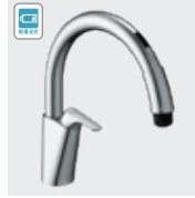
乾電池式B5 SF-NAB454SYX SF-NAB454SYXN ¥97,000