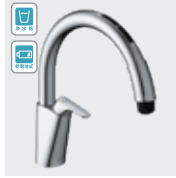
乾電池式B6 (浄水器ビルトイン形) JF-NAB464SYX(JW) ¥147,000