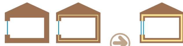
1980年頃の家 [断熱材入っていない単板ガラス] 1990年頃の家 [断熱材GWI10kg/30mm 単板ガラス] 最近の家 [断熱材GWI6kg/100mm ペアガラス]

最近の家と1990年頃の家、1980年頃の家では、断熱の仕様が異なり、夏・冬の快適性も大きな差があります。