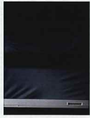
一般的な複層ガラス