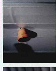
飛来物から窓をしっかりと守り、 窓ガラスが割れるのを防ぐことができました