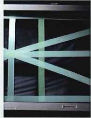
養生テープ対策済 複層ガラス