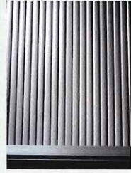
シャッター：耐風タイプ