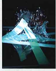
植木鉢のような飛来物でもガラスが割れ、 室内に破片が飛び散ってしまいます