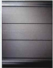
雨戸：断熱タイプ (Dan パネル雨戸)