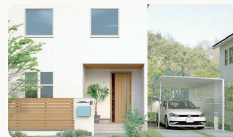
株式会社エス・エス・エス