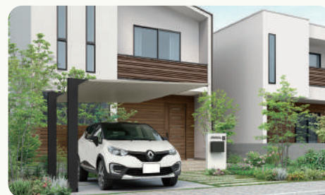
株式会社エス・エス・エス