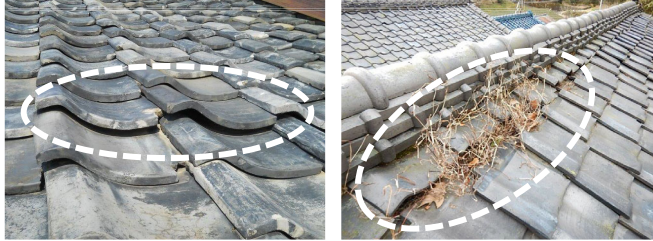
瓦に浮き上がりが生じている