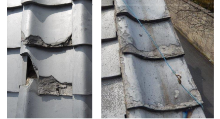
瓦が著しく破損している例