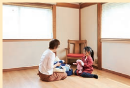
お孫さんが遊びに来た時も快適に