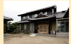
リフォーム後のI様邸

ご両親と娘さんご夫婦、お子さんと暮らす二世帯の家。昔ながらの日本家屋を活かして、いまの暮らしに合った高性能住宅にスケルトンリフォームされました。