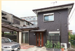
リフォーム後のK様邸

奥様の実家を住み継がれたK様ご夫婦。住み慣れた間取りはそのまま活かし、快適で安心な暮らしを求めて、断熱と耐震のリフォームをされました。