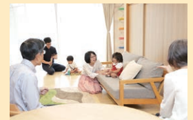
みんなが快適に暮らせる家に