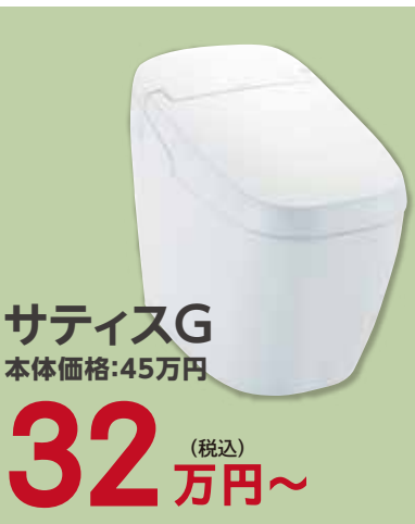
サティスG 本体価格:45万円