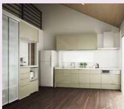
アレスタプラン2 オープンキッチン 本体価格:203万円