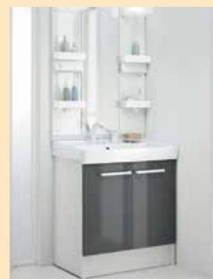
オフト(750) 本体価格:15.4万円