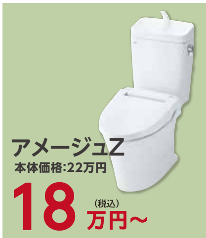
アメージュZ 本体価格:22万円