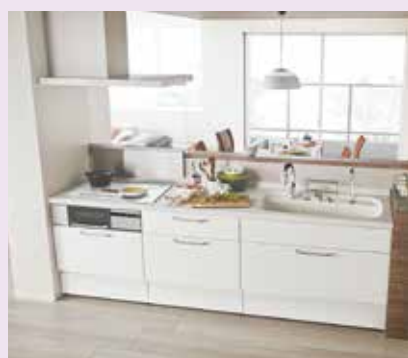
アレスタプラン1 オープン対面キッチン 本体価格:214.9万円