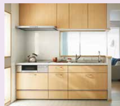
アレスタプラン4 セミオープン対面キッチン 本体価格:96.1万円