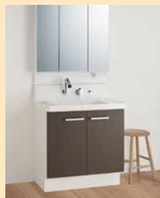
ピアラ(750) 本体価格:20.8万円