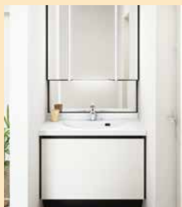
ルミス(930) 本体価格:45.3万円