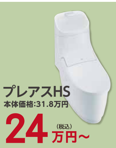
プレアスHS 本体価格:31.8万円