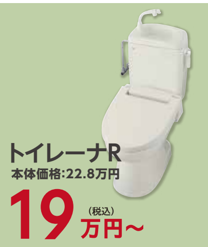
トイレナーR 本体価格:22.8万円