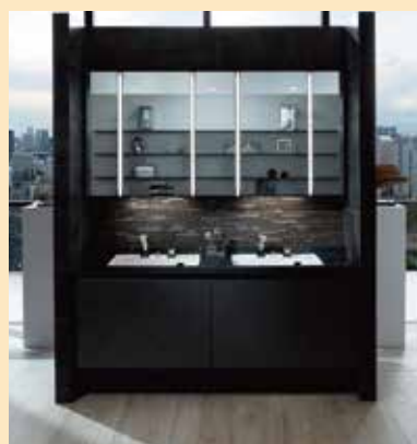
ルミス(1690) 本体価格:108.2万円