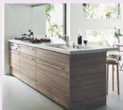
アレスタプラン3 オープン対面キッチン 本体価格:139.3万円