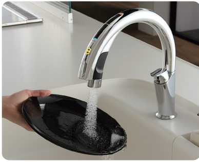
ナビッシュハンズフリー