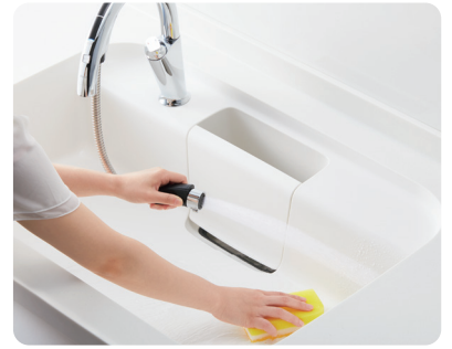
ナビッシュハンズフリー