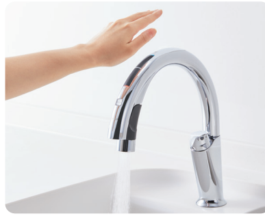
ナビッシュハンズフリー