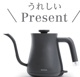
BALMUDA The Pot