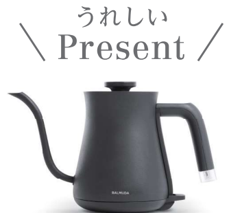
BALMUDA The Pot