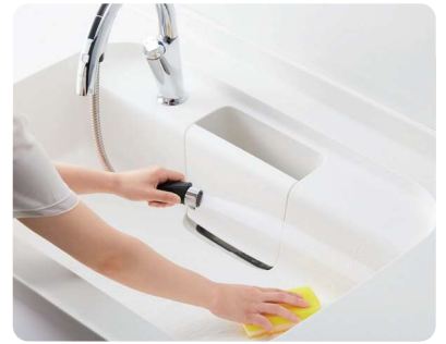
ナビッシュハンズフリー