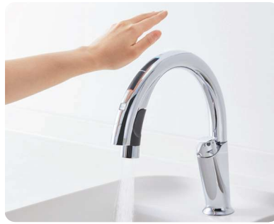
ナビッシュハンズフリー