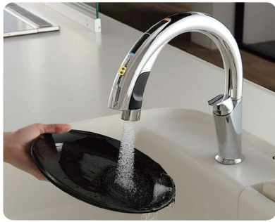
ナビッシュハンズフリー