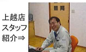
上越店 スタッフ 紹介⇒